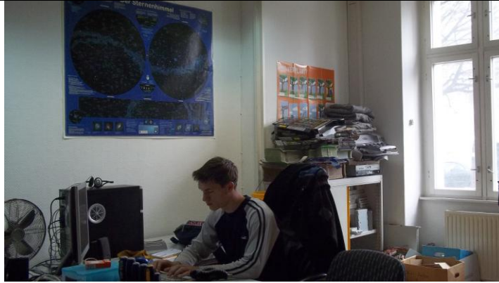
Izrada Web stranice i rad u photoshopu